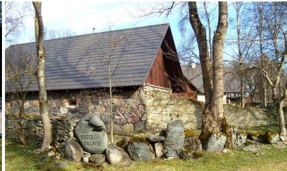
Rootsi – Kallavere kylä

Rakvere Linnoitus https://www.rakverelinnus.ee/index.php/fi