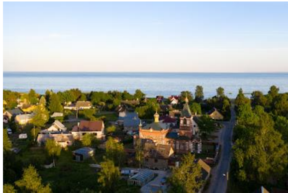
Lohusuu - Veneküla